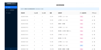
専用通知システム